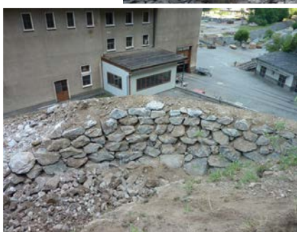
Blocs éboulés le 12.11.2010 dans le canal de Salanfe et digue pare-pierres construite en juillet 2011.