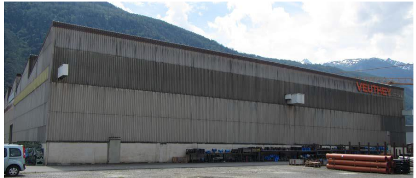
Vue de la halle Veuthey diagnostiquée

Visite initiale et diagnostic avant travaux